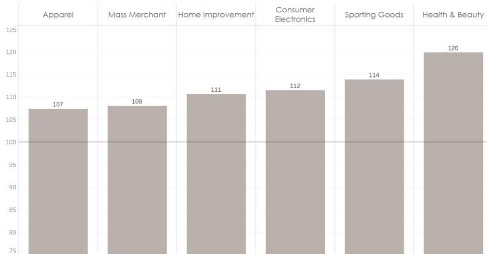
Indexed sales during the first 7 days of Winter Sales in France (Jan 9-15) compared to average during the same period in 2018 (Jan 10-16), for main retail categories.

Le mobile est de plus en plus utilisé chaque année pour profiter des soldes en ligne. D'après les données analysées, les ventes réalisées sur mobile ont augmenté de +41% la première semaine de soldes comparé à 2018.